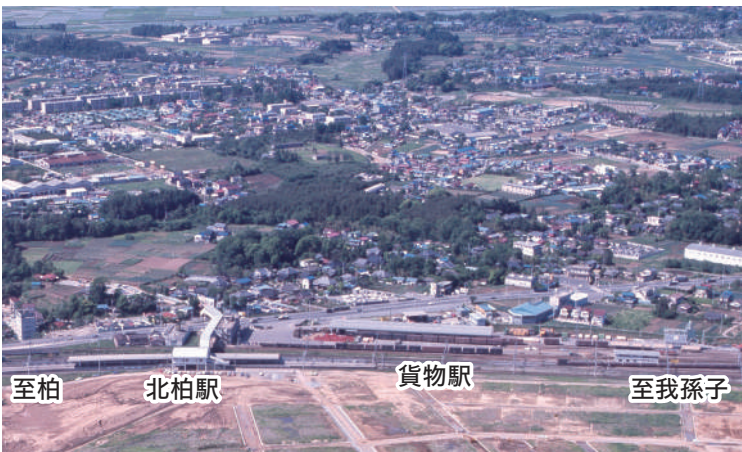
昭和50年当時の北柏駅。この頃は貨物駅と旅客駅が併設されていました

商業・子育て関連施設を整備することで、よりにぎわいのあるまちづくりを進めています。