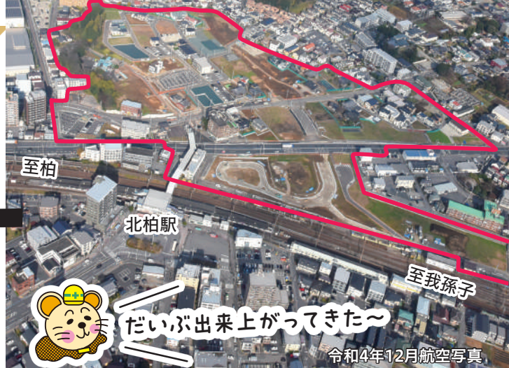
令和4年12月航空写真

こんにちは！ 工事現場大好きトチューです。最近北柏駅北口が少しずつ変化しているのをご存じですか？ 実は今新しいまちづくりが進行中のようで、早速見に行ってきました