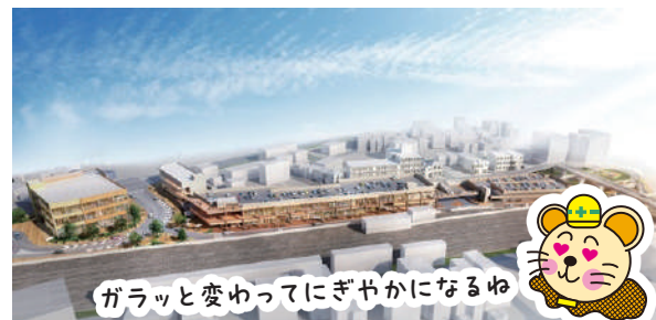
北柏駅南口側から見た施設の現時点のイメージ

他に最近、土地区画整理事業が完了した場所として、南柏駅や柏たなか駅の周辺、高柳駅西側地区が挙げられます。