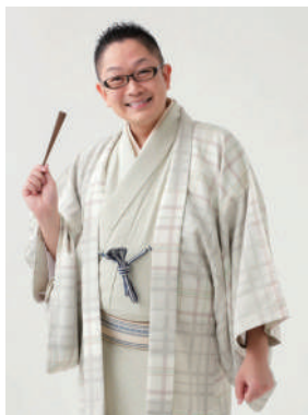
滑稽ばなしなどを武器に聞く人を魅了する春風亭昇也さん

時 9月22日(金)午後2時～4時 所 アミュゼ柏クリスタルホール 定 先着200人 費 3,000円 日 8月1日(火)午前10時から、アミュゼ柏へ電話か直接