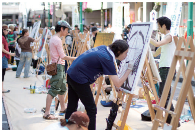
ライブペインティングではアートの制作過程が楽しめます