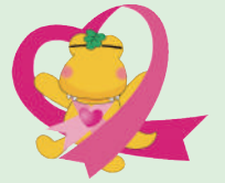
ピンクリボン×カシワニ