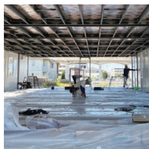
内装工事も順次行っています

公園内にできる新しい建物は、ユニット工法が採用されています。一般の在来工法と比べて耐震性、リユース度、素早い工期などに優れているんだそうです。建物は、重さおよそ3トンのユニットを10個組み合わせたもので、一つずつクレーンで慎重につり上げながら作業を行っていました。あらかじめ工場で作ったユニットを、一つずつ大型トラックで運んで現場で組み立てていくのですが、見る見るうちに建物が出現し、なんと1日で設置完了。組み立てに係る作業員もたった4人というから驚きです！