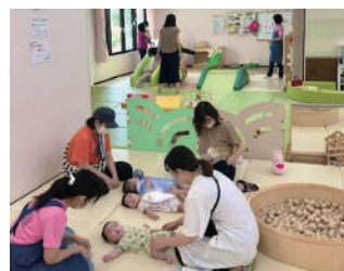
ねんね期のお子さんでも安心して利用できるふかふかマットも！（写真は9月まではぐはぐひろば若柴）

これまで十余二の青少年センター内にあった、地域子育て支援拠点の「はぐはぐひろば若柴」の機能を引き継ぎ、「はぐはぐひろば柏たなか」の名称で開設予定です。駅に近い公園の敷地内という立地からも、多くの親子連れでにぎわいそうですね。