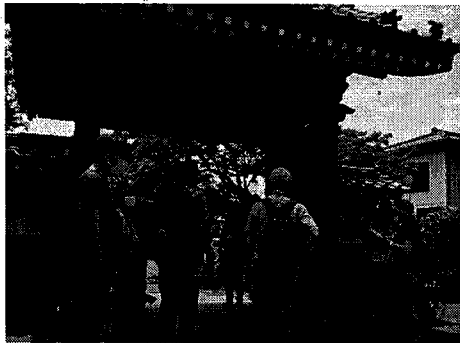
高柳歴史ウォーク