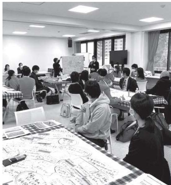
令和4年12月会議開催の様子