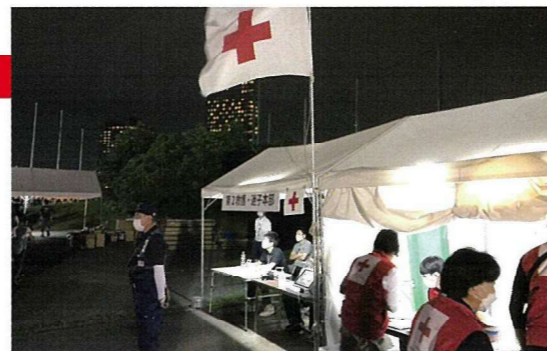
奉仕団が花火大会で臨時救護を行いました

千葉県花火大会臨時救護 赤十字キッズクロス 赤十字活動推進会議・研修会(市区町村担当対象)