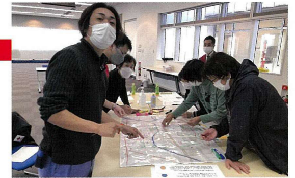
防災教育の指導者の知識の向上を図りました

救急法指導員養成研修 防災教育事業指導者フォローアップ研修 救護班要員主事研修会 青年奉仕団研修会 高速自動車国道等合同訓練 青少年赤十字スタディーセンター