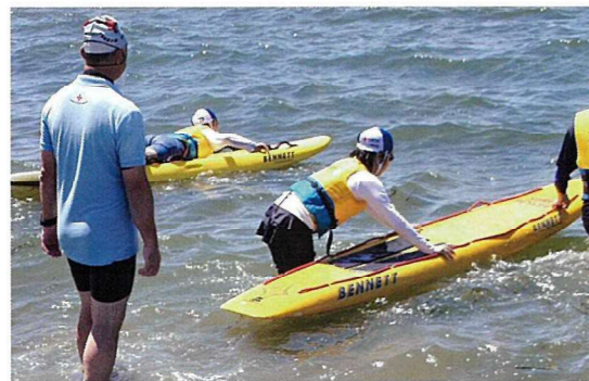
子ども達にライフセービングの体験の場を設けました