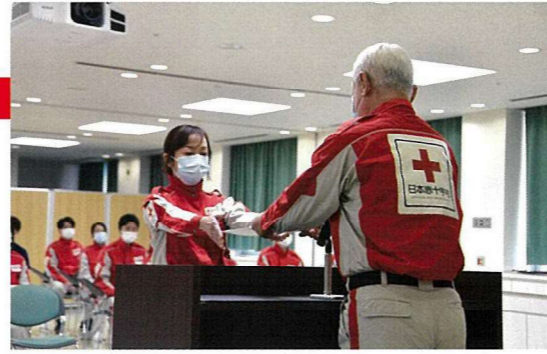
医療救護班の任命をしました

救護員任命式・研修会 青少年赤十字指導者協議会役員会・総会 防災ボランティア推進協議会 地区・分区新任事務委員研修会