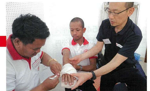
ラオスにおける救急法普及のため職員を派遣しました

千葉県支部災害対策本部運営訓練 救急法・幼児安全法指導員継続研修 ラオス救急法普及事業 海上保安部合同訓練