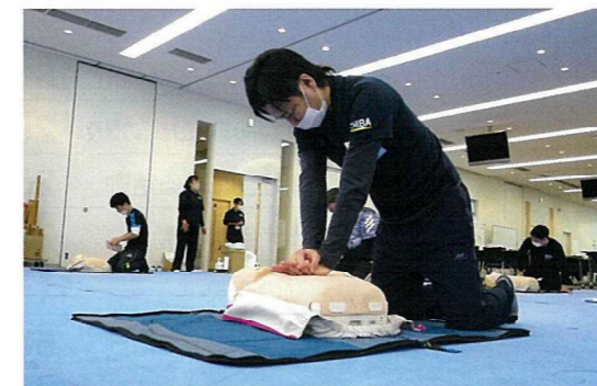
新たに10名の救急法指導員を養成しました

第2ブロック支部先遣要員訓練 日赤災害医療コーディネート研修会 救急法新任指導員研修会 防災ボランティア研修会