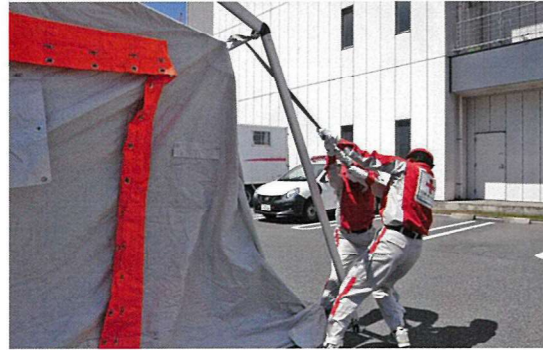
救護所用テントの設営訓練を行いました