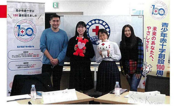
海外青少年赤十字メンバーと交流しました

青少年赤十字100周年記念国際交流 レッドクロスボランティアスクール 航空機事故消火救難訓練 九都県市合同防災訓練(千葉県会場) 語学奉仕団研修会