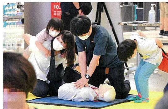
商業施設で救命体験イベントを開催しました