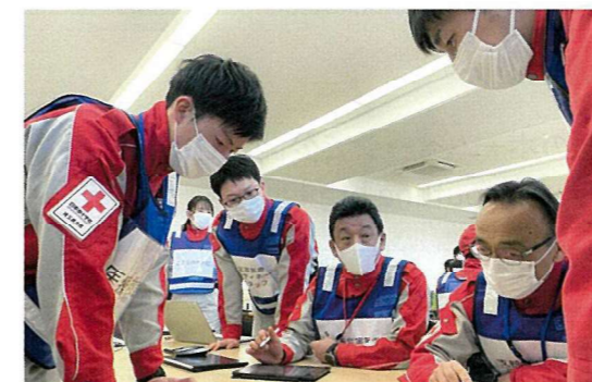
琦玉県が被災した想定で災害対策本部の訓練を行いました

健康生活指導員継続研修 第2ブロック被災地支部災対本部訓練 防災イベント「まなぼうさい」 青少年赤十字指導経験者研修