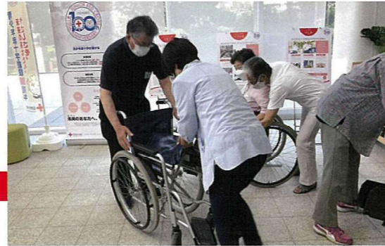
奉仕団員が車いすの指導方法を学びました

防災ボランティアリーダー研修会 特別奉仕団基礎研修会 青少年赤十字トレーニングセンター指導者研修会 水上安全法指導員研修会 災害救護看護師主事研修会 赤十字奉仕団指導技術等研修会