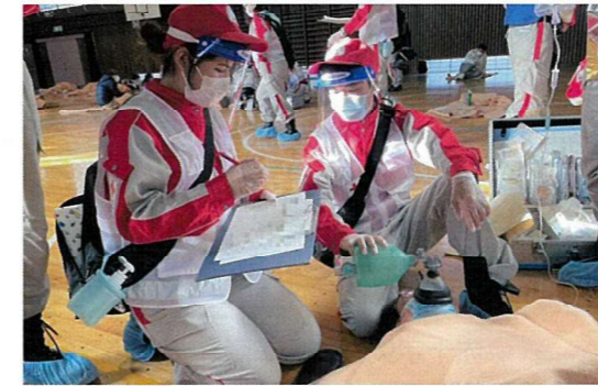
関東圏の日赤支部と合同で医療救護訓練を行いました

防災ボランティア地区リーダー養成講習 救急法キャンペーン 日本赤十字社第2ブロック支部総合訓練 青少年赤十字高校メンバー協議会研修