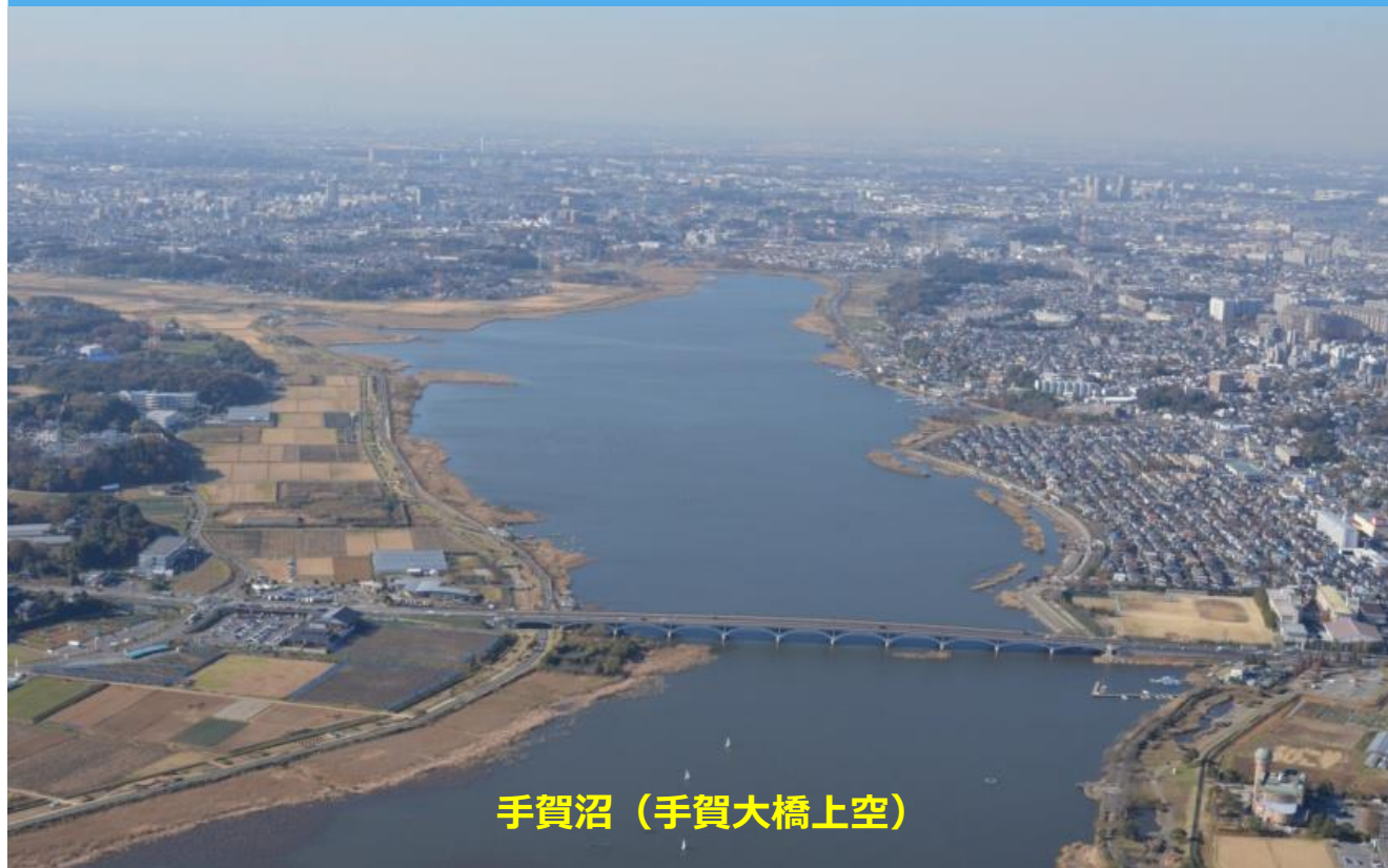
手賀沼（手賀大橋上空）