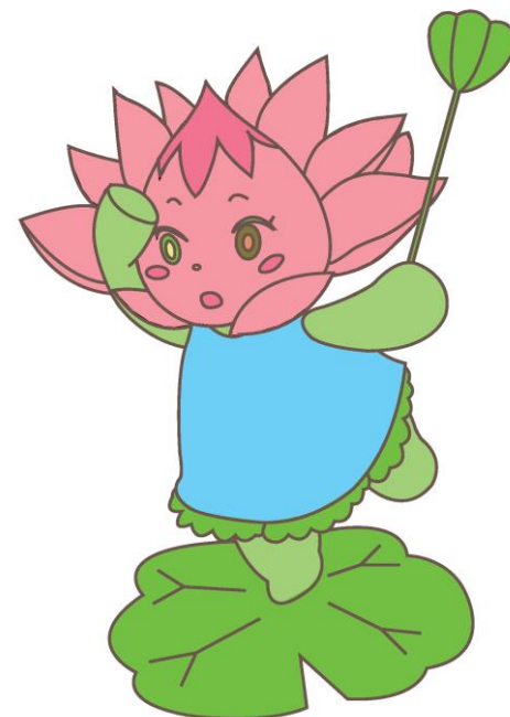
柏市下水道公式キャラクター れんこちゃん