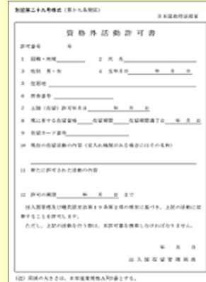
※3 資格外活動許可書