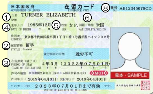
在留カード例（表面）