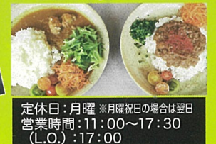
定休日：月曜 ※月曜祝日の場合は翌日 営業時間：11:00~17:30 (L.O.) : 17:00

手賀沼を望む湖畔のカフェレストラン。オーガニックコーヒーと地元野菜にこだわった自慢のカレーメニューの他、季節のスイーツもおすすめ！店内に設置してある双眼鏡で窓からバードウォッチングをお楽しみいただきながら、ゆっくりとおくつろぎいただけます。