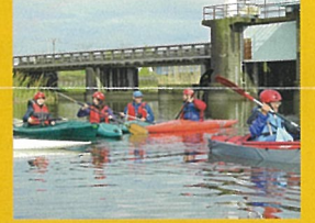
活動日：日曜、祝日（完全予約制） 問合せ： https://canoe-kashiwa.jimdo.com/

カヌーはやったことないけれどちょっと興味のある方、手賀沼の自然に触れてみたいという方、アウトドアスポーツ大好きという方、普段からカヌーライフを楽しんでいる方など、この手賀沼を拠点にカヌーをやってみませんか？