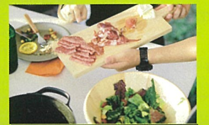
定休日：月曜 ※月曜祝日の場合は翌日 営業時間：10:00~16:30

大きな空のもと、ゆったりとしたBBQが楽しめます。BBQ以外でもプレイパークとしてどなたでも自由に遊べます。併設のコーヒースタンドで淹れたてのコーヒータンポで焼くマシュマロが大人気！ピクニック気分を気軽に楽しめます。