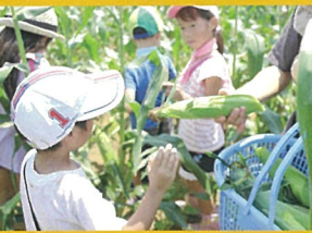
開催日：5月~11月 問合せ： http://www.okutega-tourism.jp/tour/index.html

四季を通じて、田植え・稲刈りのほか、旬の収穫体験 & BBQを実施しています。首都圏とは思えぬ自然に囲まれた畑で収穫体験をしませんか？（予約制）