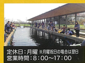
定休日：月曜 ※月曜祝日の場合は翌日 営業時間：8:00~17:00

ご家族で釣り（ニジマス・金魚）が楽しめるほか、アユや釣ったニジマスをいり焼きするサービスもおすすめ！（日曜・祝日限定）夏季はじゃぶじゃぶ池でニジマスのつかみどりも大好評です。